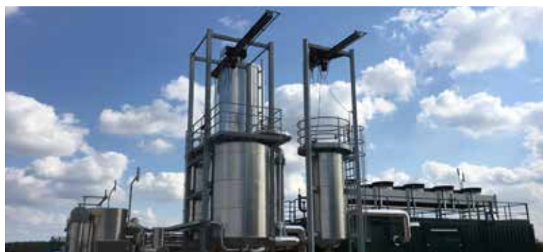
L'installation de production de biogaz à Parum (DE) prépare du biogaz brut à injecter dans le réseau.

Même s'il est garanti que la plus-value écologique commercialisable du biogaz naturemade star appartient aux clients, les importations ne figurent actuellement pas dans le bilan climatique national de la Suisse. Ceci est dû au principe de territorialité stipulé par le Protocole de Kyoto, selon lequel les émissions qui ont pu être évitées sont attribuées à l'inventaire des gaz à effet de serre du pays dans lequel le biogaz a été produit. Les conditions-cadres régissant le transfert des droits d'émission et la prise en compte de la réduction de l'effet de serre entre la Suisse et le pays exportateur pourraient toutefois changer à l'avenir (état 2021).