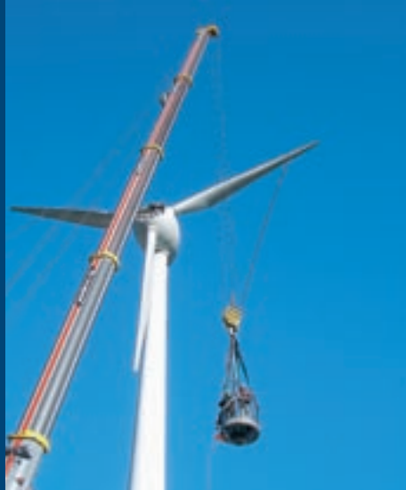
Montage de l'installation éolienne Gütsch à Andermatt